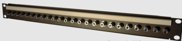
Bandeau 1 x 24 F