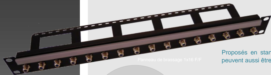
Panneau de brassage 1x16 F/F