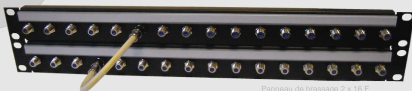
Panneau de brassage 2 x 16 F

Ces Panneaux au format 19" sont équipés de connecteurs femelles F/F de grande qualité. Réalisés en tôle d'acier 12/10 avec peinture époxy noire et renfort par retour 10 mm, ils sont équipés de larges porte-étiquettes 10 mm et d'un porte-câbles intégré.