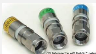
CX3 F/F connectors with PushPin™ system

Connecteurs à compression Facile à câbler Excellente tenue à la traction Faible Coût d'outillage Class A